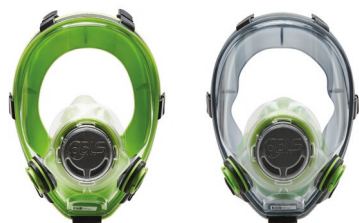
Masques complets BLS 5700 - BLS 5600