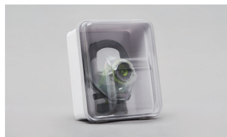
C90 – Boîtier mural.