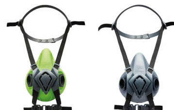
Demi-masques BLS 4000next S - BLS 4000next R