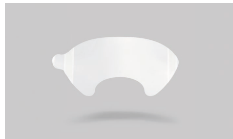
K19 – Film de protection en acétate.