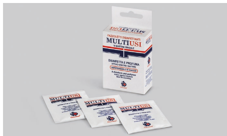
Q409 – Lingettes désinfectantes multiusages.