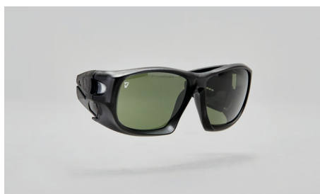
C22 – Montures pour verre de correction.