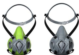
Demi-masques BLS 4000 ne»xt S - BLS 4000 ne»xt R