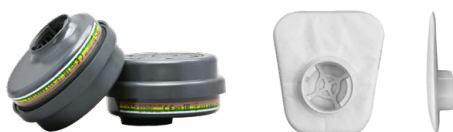
Filtres série BLS 200