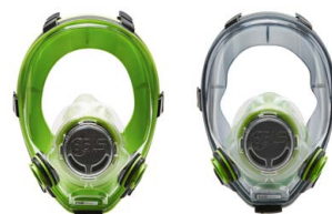
Masques complets BLS 5700 - BLS 5600